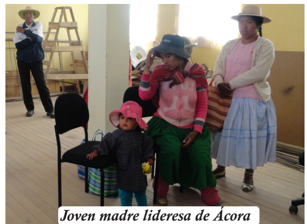
Joven madre lideresa de Ácora

Reconoce que la obligación de la atención al niño y al adolescente se extiende a la madre y al niño mismo. El Artículo 6º establece que es obligación del Estado crear condiciones adecuadas para la atención de la madre, antes, durante y después del parto, con especial cuidado para la adolescente madre.