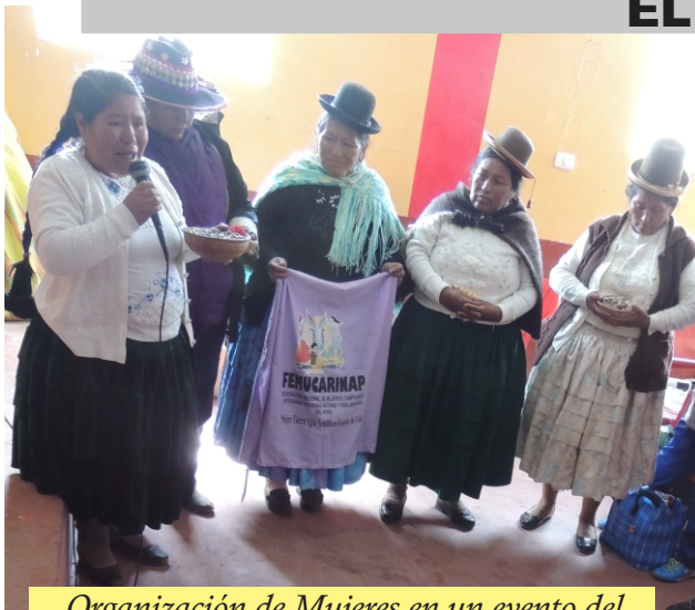
Organización de Mujeres en un evento del Centro Poblado La Rinconada

Diversas situaciones que se dan en nuestra sociedad tienen mayor incidencia y repercusión en las mujeres, por ejemplo: