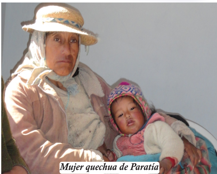
Mujer quechua de Paratía

La Convención Americana sobre Derechos Humanos de San José de Costa Rica, rechaza la discriminación por sexo. Art. 1, Inc. 1.