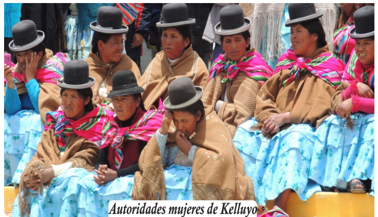
Autoridades mujeres de Kelluyo

Existen alternativas ideadas por la población para la defensa de las mujeres. Es el caso de las Rondas Campesinas que actúan en la persecución y sanción del agresor y que dan protección y defensa a las mujeres maltratadas.