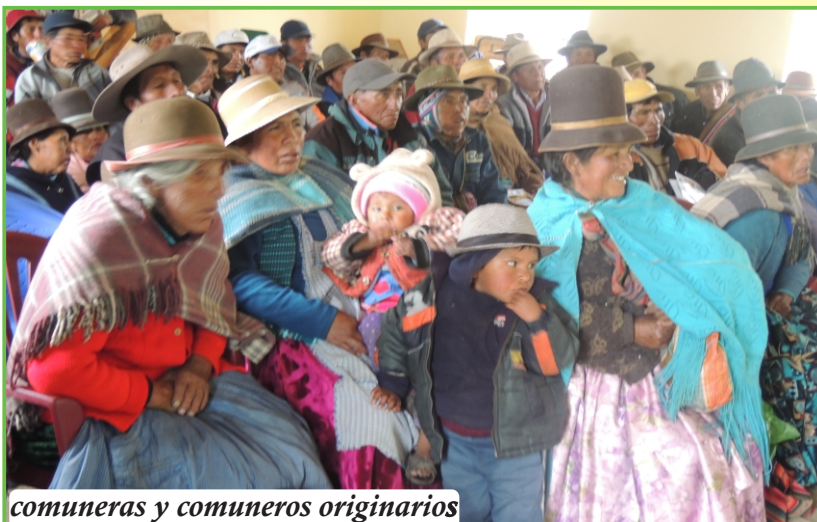
comuneras y comuneros originarios

La Convención de Belén Do Pará, Convención Interamericana para prevenir, sancionar y erradicar la violencia contra la mujer. 9 de junio de 1994, aprobada por el Congreso de la República el 22 de marzo de 1996.