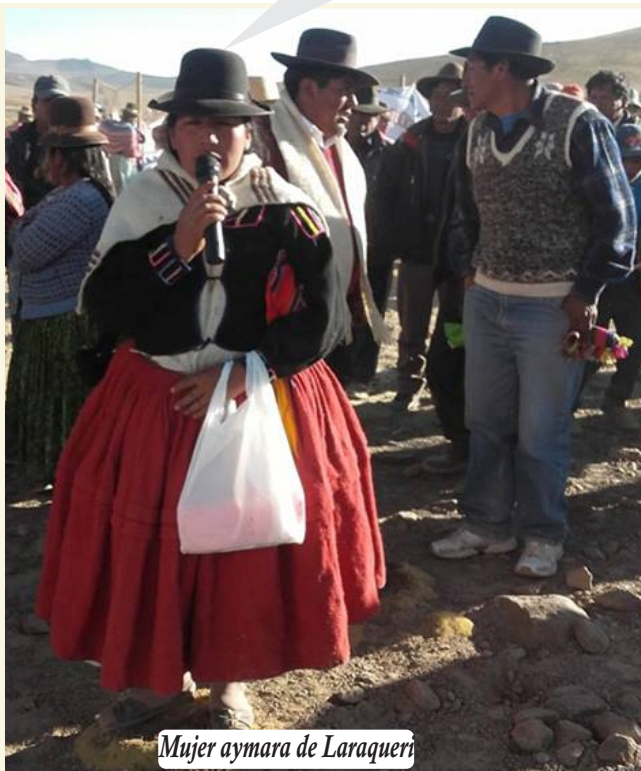
Mujer aymara de Laraqueri

Mujer lucha contra la marginación y la injusticia