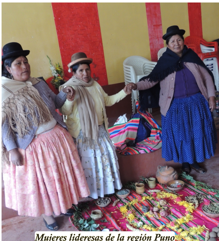
Mujeres lideresas de la región Puno

La violencia contra la mujer también incluye el maltrato psicológico que es: insultar a una mujer, amenazar con lastimarla, tratarla mal delante de otros, acusarla de hechos de los que no es responsable, desvalorizarla ante sus hijas e hijos, etc.