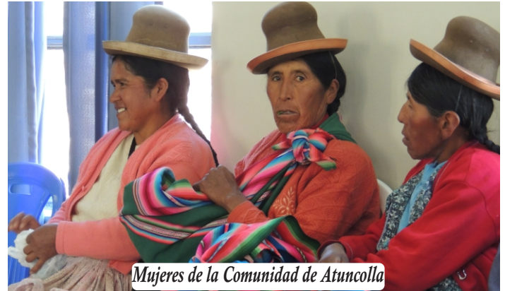
Mujeres de la Comunidad de Atuncolla

LA CONSTITUCIÓN POLÍTICA DEL PERÚ LE RECONOCE A LA MUJER TODOS Y LOS MISMOS DERECHOS QUE AL VARÓN.