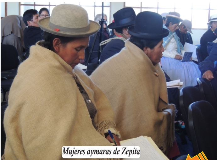
Mujeres aymaras de Zepita

Son delegaciones policiales atendidas por personal policial femenina para la exclusiva atención de mujeres maltratadas. Cuentan con apoyo legal, psicológico y social. Donde ésta exista llame, consulte o acuda personalmente.