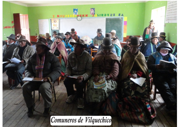
Comuneros de Vilquechico

La ley condena la agresión a la esposa, incluyendo la agresión sexual que consiste en forzar a una mujer a tener relaciones sexuales en contra de su voluntad, u obligarla a practicar actos sexuales que le desagradan.