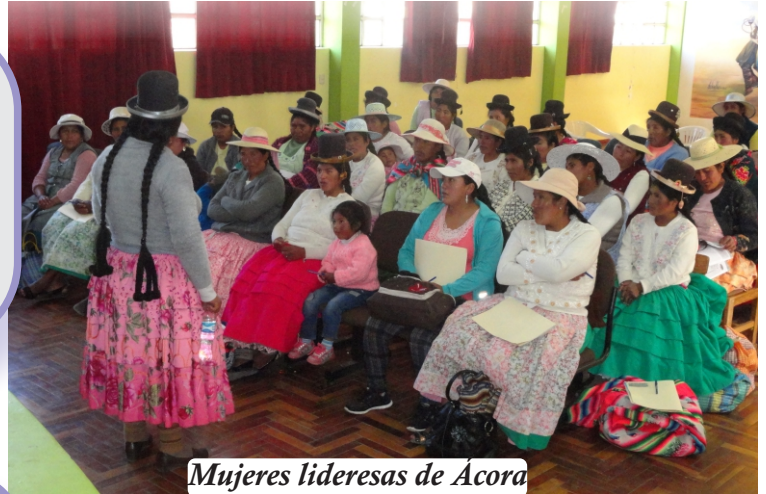
Mujeres lideresas de Acora

La Declaración Universal de los Derechos Humanos contempla la no discriminación por razón de sexo. Art. 2 Inc. 1.