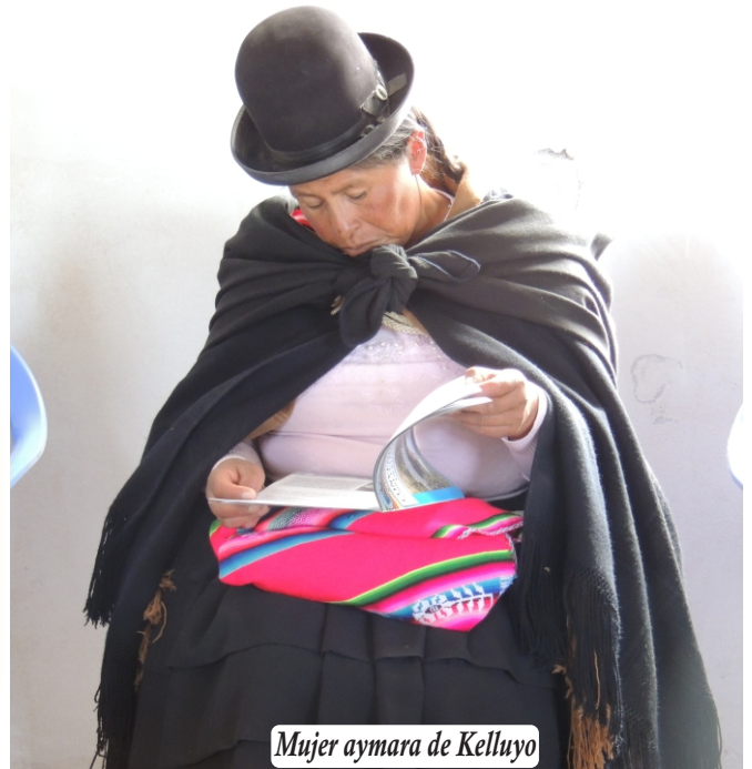
Mujer aymara de Kelluyo