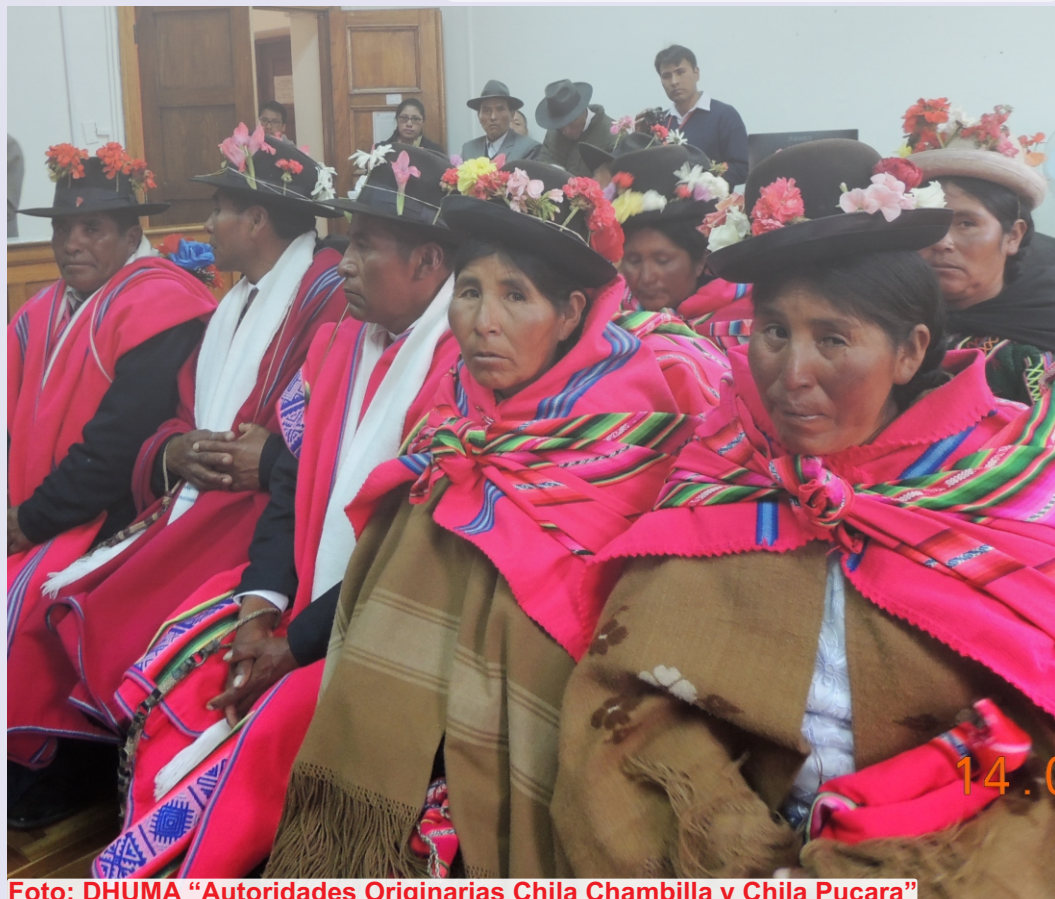
"Autoridades Originarias Chila Chambilla y Chila Pucara"